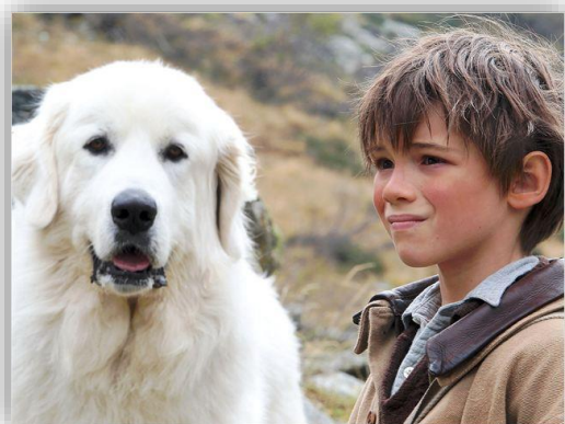
Belle et Sébastien

Ecris qui sont ces personnages dans le film :