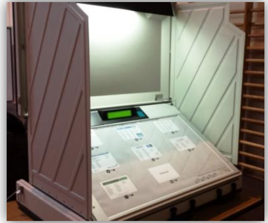
Machine pour voter de manière électronique, sans papier

Des panneaux sont mis à leur disposition pour poser leurs affiches. Ils n'ont pas le droit d'en mettre ailleurs que sur ceux-ci.